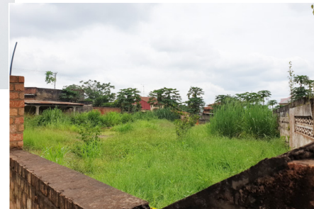
Parcelle où la bibliothèque devrait être construite

scolaires, équivalant à 40 000 $ environ. Il ne s'agit encore que d'un projet à l'heure actuelle.