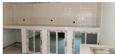
Avancée des travaux